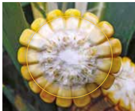
Mlečna linija na zrnju kukuruza

Nakon kasne voštane zrelosti menja se i opada kvalitet nakupljene suve materije, posebno se povećava sadržaj lignina što direktno utiče na smanjenje svarljivosti silaže i time smanjuje njeno iskorišćenje.