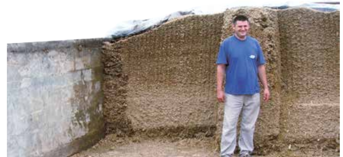
Pravilno izuzimanje silaže

Aerobno propadanje rezultira brojnim gubicima suve materije, energije, proteina, šećera itd. Pri tome se stvaraju štetne materije kao što su mikotoksini, amonijačni azot i alkohol. Čuvanje inokulirane silaže je bolje i u proseku iznosi 89 sati, a ona koja nije tretirana 65 sati. Aerobna nestabilnost je ustanovljena onda kada je temperatura silaže porasla za više od 1 stepen iznad temperature ambijenta.